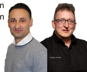
Eure Vertreter in der Großen Tarifkommission

Eine weitere Änderung wird es bei den Fragen der Beiträge der IG Metall geben. Ab April 2022 beträgt der Beitrag sowohl während der aktiven, als auch während der passiven Phase der Altersteilzeit 1% vom Brutto. Bis dato andere ATZ-Beiträge sind hiervon nicht betroffen. Ebenso beträgt ab April 2022 der Krankengeldbeitrag 0,5% vom Krankengeld. In diesem Zusammenhang wird es im Februar 2022 auch eine entsprechende Beitragsanpassung geben, wenn die Tariferhöhung zur Auszahlung kommt.