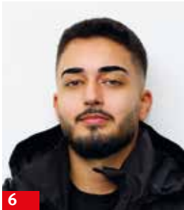
6 Can Tunay Zerspanungsmechaniker Jugendvertrauensmann