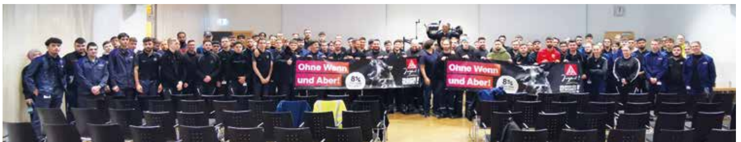
Jugendversammlung September 2022