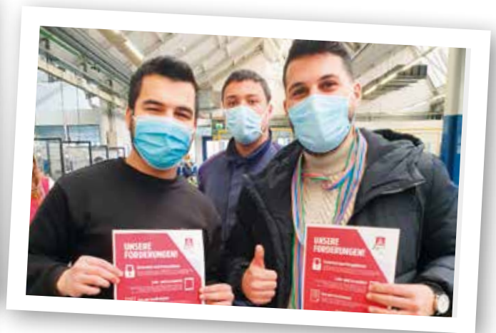
Aktionen zum MTVA