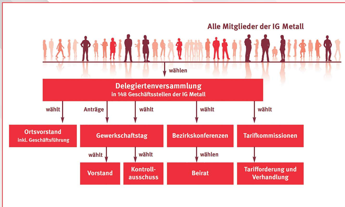
Schaubild: IG Metall, Illustration: iStock/Leontura

148 regionale Geschäftsstellen bilden die Basis der IG Metall bundesweit. Über die Hälfte dieser Geschäftsstellen betreuen jeweils mehr als 10.000 Mitglieder. Rund 90.000 Mitglieder umfasst dabei die Geschäftsstelle Stuttgart.