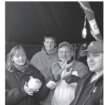
Sammlung Kom I

und Kollegen von Neupack oft und mit verschiedenen Aktionen unterstützt. Mehr als 84 Tage haben sie vor den Toren ausgehalten, bei Wind und Wetter und auch an Heilig Abend und den Weihnachtsfeiertagen.