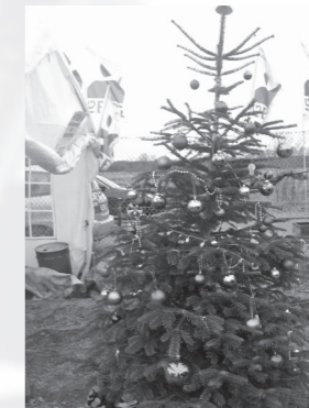
Spende Daimler VL

In Hamburg wurden die Streikenden immer wieder öffentlich unterstützt, denn sie sind mitten in der Stadt. In Rotenburg befindet sich der Betrieb weitab vom öffentlichen Leben. Deshalb haben wir als Vertrauensleute und MetallerInnen die Kolleginnen