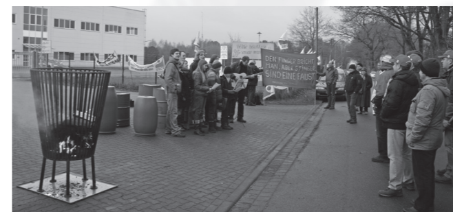
Entzünden des Streikfeuers

So wollten die GewerkschafterInnen verhindern, dass weiter jeder anders (nach „Gutsherrenart“), also nach Nase bezahlt wurde, das Löhne unter 8 Euro gezahlt wurden, dass es immer wieder Probleme bei Schichtteilungen und Überstunden gab. Die Firma Neupack produziert an 2 Standorten, in Hamburg und in Rotenburg.