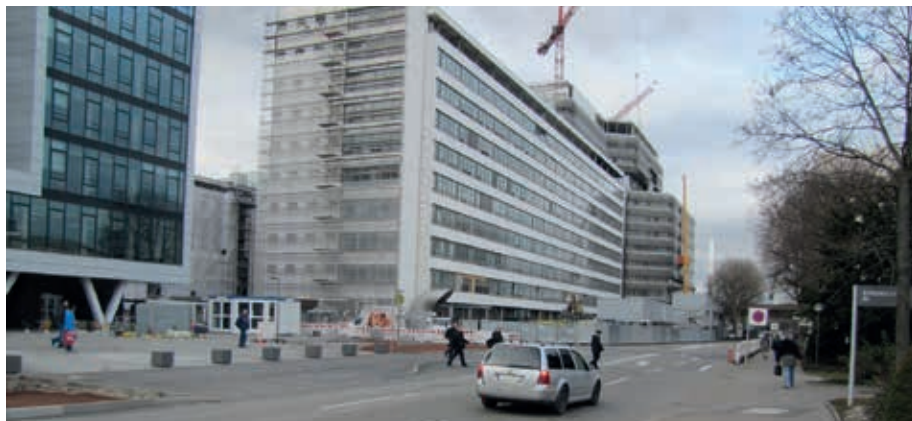
Das Überqueren der Mercedesstraße am Gebäude 128 ist jeden Tag eine Herausforderung für die Beschäftigten und ihre Schutzengel

Richtig gefährlich wird es allerdings am Ende dieser Wegführung: An der Stelle an dem die Kolleginnen und Kollegen über die Straße müssen, um in das Gebäude 128 oder 132, 131/1 zu kommen. Zudem bedeutet das Überqueren der Straße bei Dunkelheit und schlechtem Wetter bei dem hohen Fahrzeugaufkommen ein absolut unnötiges „Rus-