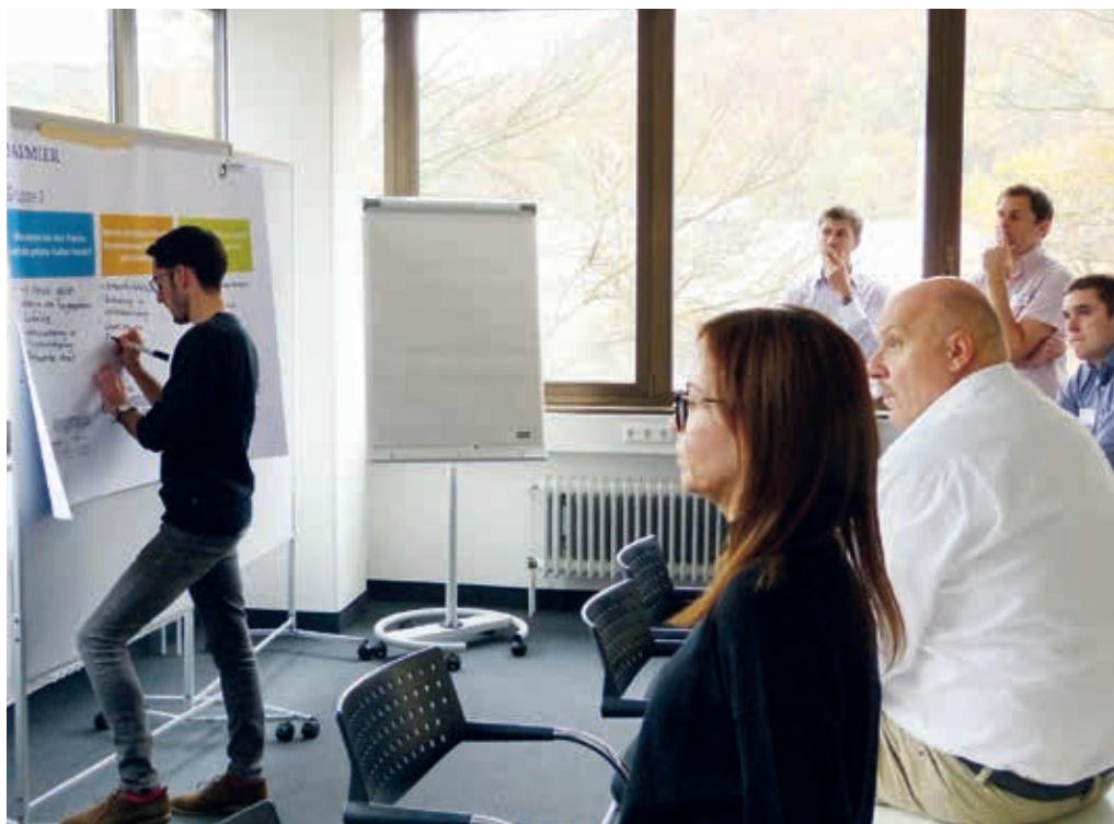
Die Teilnehmer nutzen die Möglichkeit, in den Workshops ihre Erfahrungen und Erwartungen einzubringen

Die Ergebnisse der Online-Befragung sind in den Workshops weitgehend bestätigt worden, so das Fazit von