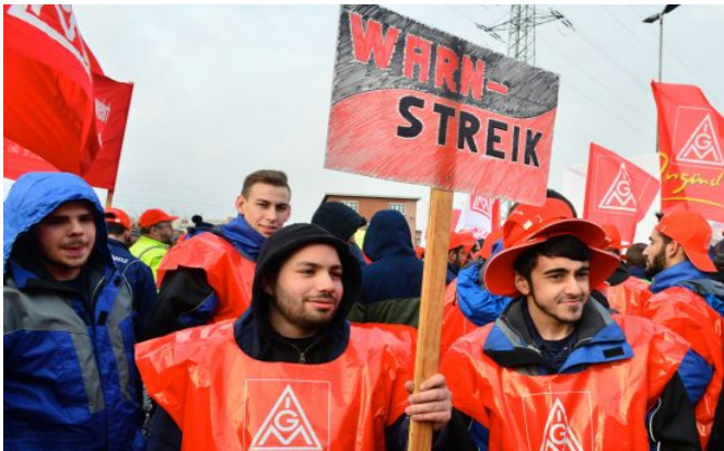
Tarifrunde 2015 – Wir fordern einen attraktiven Weiterbildungs-tarifvertrag!