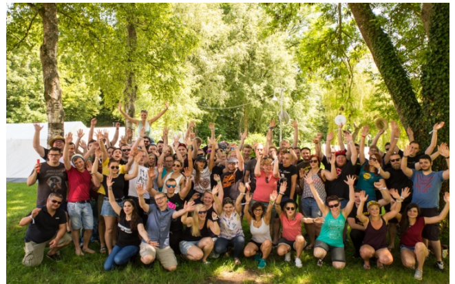
Auf unserem Jugendcamp finden jedes Jahr Workshops statt. Der Spaß kommt dabei aber auch nicht zu kurz!