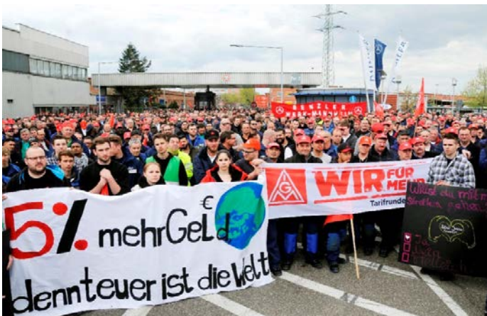
Warnstreikaktion in der Tarifrunde 2016.