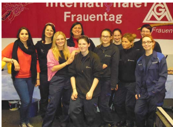
8. März - Internationaler Frauentag mit den Frauen aus der Ausbildung.