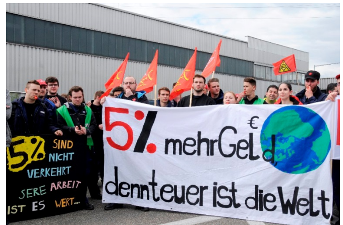
Die Benz-Jugend ist immer vorne mit dabei!