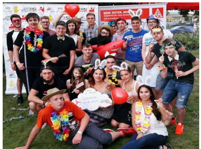
Ca. 200 Auszubildende waren an unserem Kennenlerngrillen der IG Metall-Jugend anwesend.