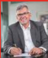
Seit 125 Jahren für gute Arbeit

Als sich die Arbeiterinnen und Arbeiter vor 125 Jahren zusammenschlossen, taten sie es aus großer Not. Sie arbeiteten mehr als 10 Stunden am Tag für einen Hungerlohn – und es gab keinerlei Rechte oder soziale Absicherung. Was die IG Metall im Laufe dieser 125 Jahre auf die Wege gebracht und umgesetzt hat, wurde damals für völlig ausgeschlossen gehalten. Ein gutes Leben war und ist heute nur mit guter Arbeit möglich. Und gute Arbeit ist sicher, gerecht und selbstbestimmt. Gerecht geht nur mit Tarifverträgen. Solidarität ist das Bindemittel, das die Gesellschaft zusammenhält. Und Solidarität lebt von einer Einsicht, die 1891 genauso gültig war wie heute. So haben sich die Probleme von vor 125 Jahren vielleicht verändert, aber nicht aufgelöst. Deswegen ist es auch künftig wichtig mit einer starken Basis und viel Engagement weiterhin für bessere Arbeits- und Lebensbedingungen zu kämpfen. Darüber sind sich auch die Mitglieder am Mercedes-Benz Standort Sindelfingen bewusst und wissen ganz genau warum sie Teil der IG Metall sind.