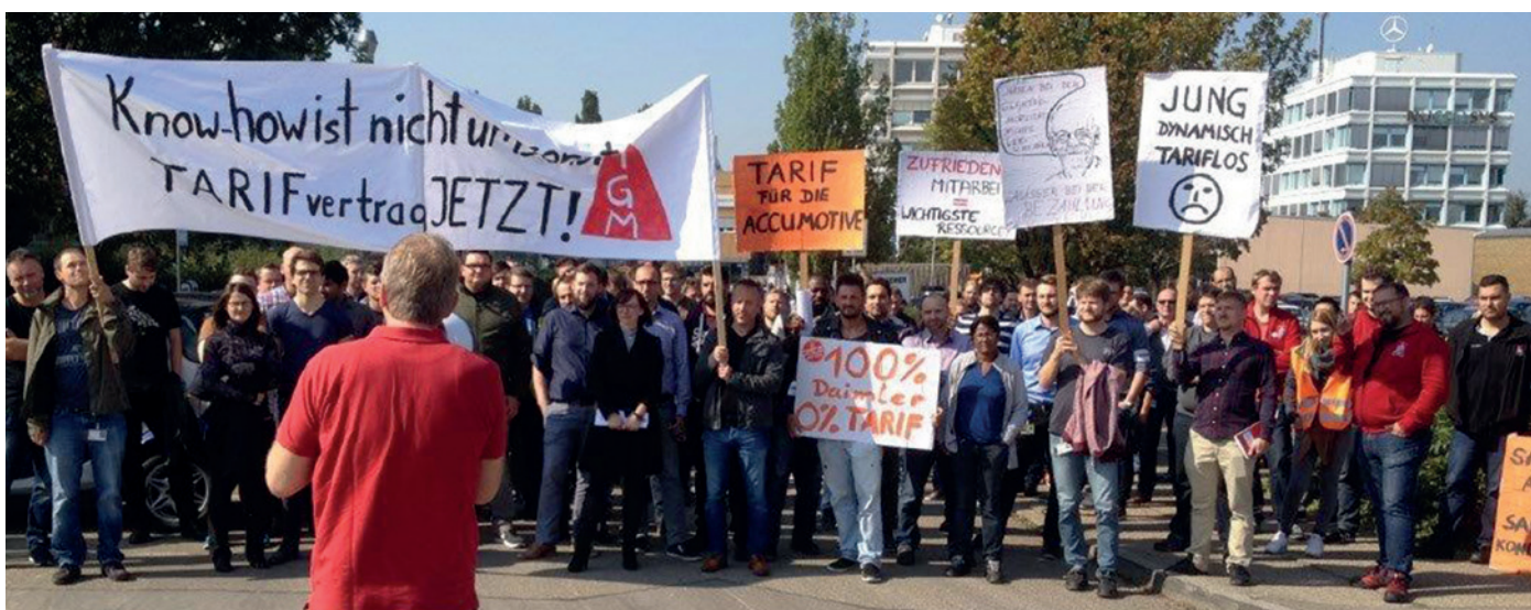
Kundgebung bei der Deutschen Accumotive in Nabern im September 2017. Die Belegschaft fordert einen Tarifvertrag