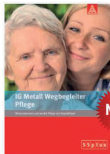
IG Metall Wegbegleiter Pflege

Wissenswertes rund um die Pflege von Angehörigen