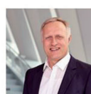
Centerleiter Presswerk im Werk Sindelfingen der Daimler AG