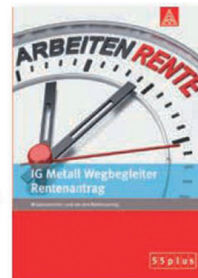
IG Metall Wegbegleiter Rentenanspruch

Wissenswertes rund um die Pflege von Angehörigen