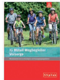
IG Metall Wegbegleiter Vorsorge

Wissenswertes rund um den Rentenanspruch